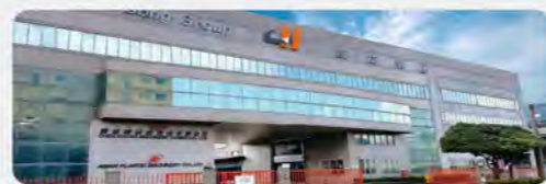
震雄台湾生产基地