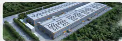
震雄陆河生产基地