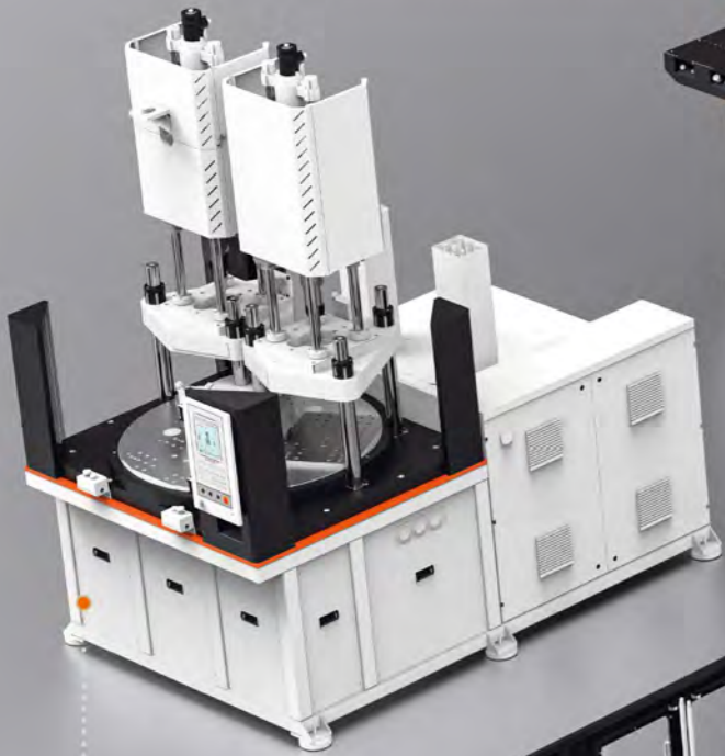
V系列-SD双滑板 双下模左右交替