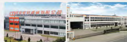
震雄顺德生产基地