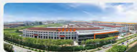
震雄深圳工业园——生产总部