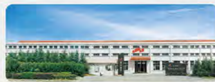
震雄宁波生产基地