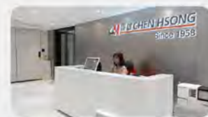
震雄集团香港总部

1990年，创始人蒋震博士将名下股份(当时市值约8亿港元)捐出成立“蒋震工业慈善基金”，开创了香港“裸捐”先河。成立至今，基金会各项捐款累计总额约5亿港元，基金会运作资金均来自震雄集团股息。与全球超30所高校合作，培养工业科技及管理人才超10万名。因此您每一次选择震雄，都是一次善举，都是一次对国家工业的支持。